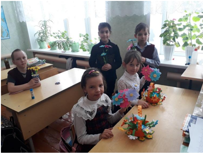
На фото: учащиеся 2 класса с подарками