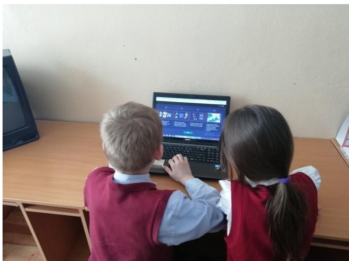
На фото: идет «Урок цифры»

С 25 февраля по 1 марта 2019 года учащиеся нашей школы приняли участие во всероссийском образовательном мероприятии «Урок цифры» на тему «Искусственный интеллект и машинное обучение». Это были необычные интересные уроки информатики.