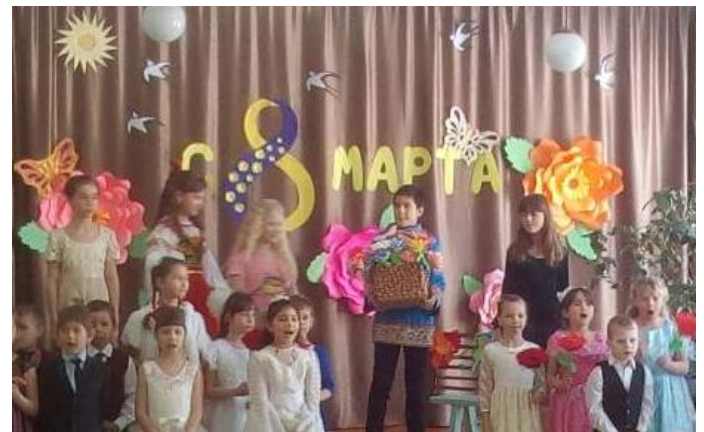
На фото: участники концерта

Праздничный концерт прошел после окончания уроков и не оставил никого равнодушными: ни зрителей, ни самих участников. Ребята порадовали своим артистизмом. Интересным было завершение выступления, когда на сцену вынесли большую корзину, наполненную цветами, и все цветы подарили присутствующим в зале женщинам.